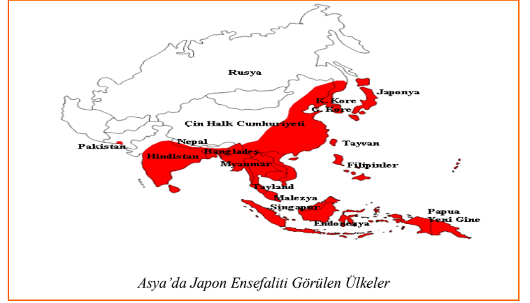
Asya'da Japon Ensefaliti Görülen Ülkeler

Güneydoğu Asya'ya gidecek yolcular için Japon Ensefaliti (JE) enfeksiyon riski düşüktür ancak mevsime (muson mevsimi boyunca yüksektir), konaklama tipi ve maruz kalma süresine göre değişir.